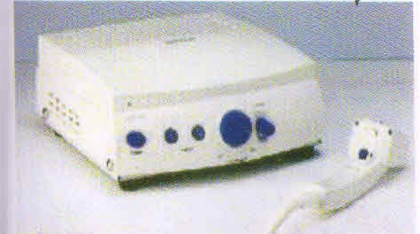
Visu 1 Vue